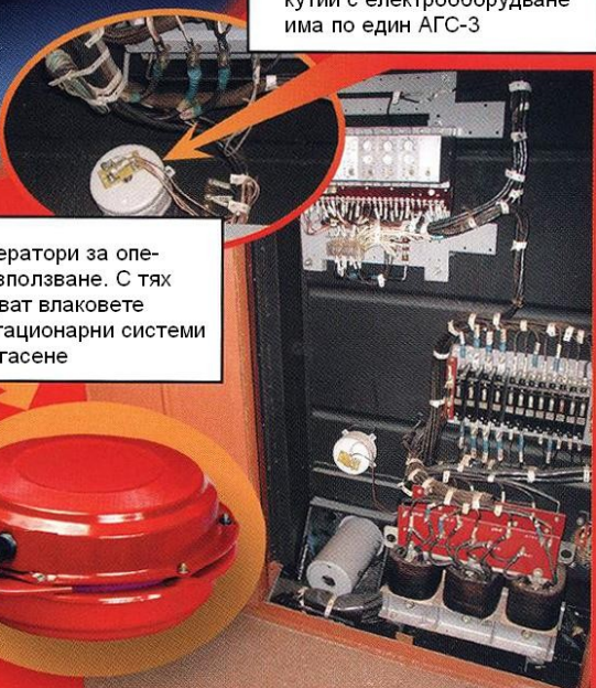
Защитата на подвагонните кутии с електрооборудване има по един АГС-3