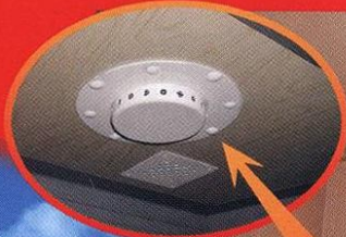
Защитата на таванската част е с осем АГС-3, или АГС-11/5 (по един в електрошкаф и по два в таванско помещение)