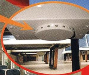
АГС-5 генератори за оперативно използване. С тях се оборудват влаковете нямащи стационарни системи за пожарогасене